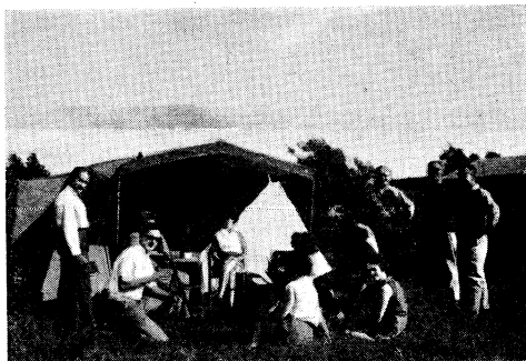
De g. à dr. : PAØBOC, 2CH, xyl 2UZ, xyl 2BW, xyl 2WH, xyl PAØBOC, 2UZ, 2BW, 2WH.

plus d'une heure et demie dimanche après midi, obligea pourtant les OMs à se réfugier dans les QRA de toile, après avoir mis l'antenne sur l'air avec ON4VY/M.