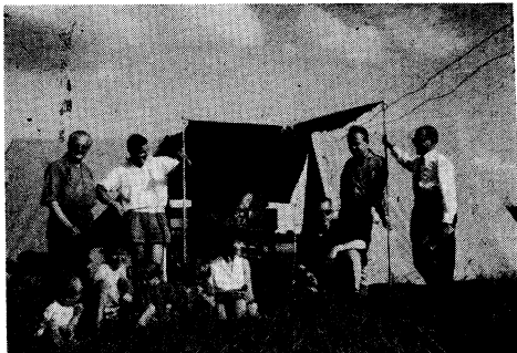
De g. à dr. : DL2UZ, xyl DL2WH, DL2CH, xyl DL2BW, DL2BW, DL2WH, PA ØBOC.

Vers 16 heures, la station était QRV, et quelques QSO tests étaient réalisés avec de fort bons QRK (ON4SN, ZO, VY, ET/P...) A 18 heures, le grand départ étaient d'abord contactés en A3 sur 80 m, puis on passa sur 40 m en A1. Les QRK étaient en général fort bons les stations G, moins forts avec HB9 et DL. Les opérateurs (2BW, WH, BV, BG, CH), se relayaient et consentaient difficilement à prendre un peu de repos! Les XYL avaient pourvu les OM de moults thermos de reconstituant... et le temps était toujours complaisant. Un orage QRO, qui dura