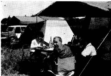
Le QRM/gastro... De g. à dr. : xyl 2WH, DL2BG, xyl 2BW, DL2CH, DL2BV.