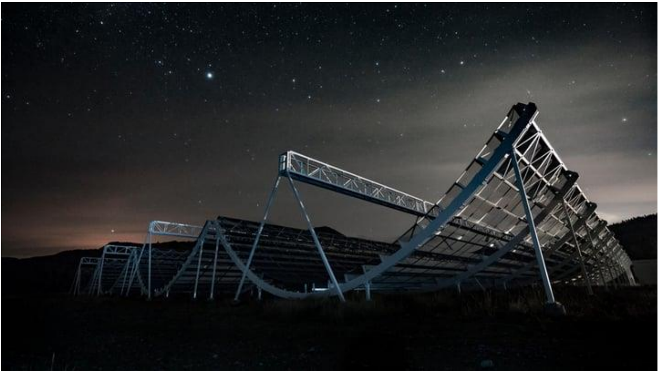
Le télescope CHIME, situé à l'Observatoire Fédéral de Radioastrophysique, installation nationale d'astronomie exploitée par le Conseil National de Recherches du Canada, le 3 novembre 2016.

En février 2024 , le radiotélescope canadien CHIME a observé pour la première fois un sursaut radio rapide qui devait se révéler répétitif, et qui est désormais connu sous le doux nom de code FRB 20240209A . Entre février et juin 2024, il a été observé vingt et une fois. L'équipe canadienne de l'Université McGill a ainsi pu localiser la source de ce FRB, qui se trouverait à quelque deux milliards d'années-lumière.